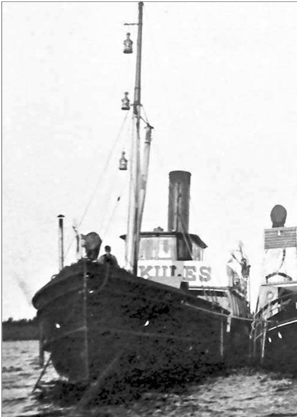
Bengt Westins saml.