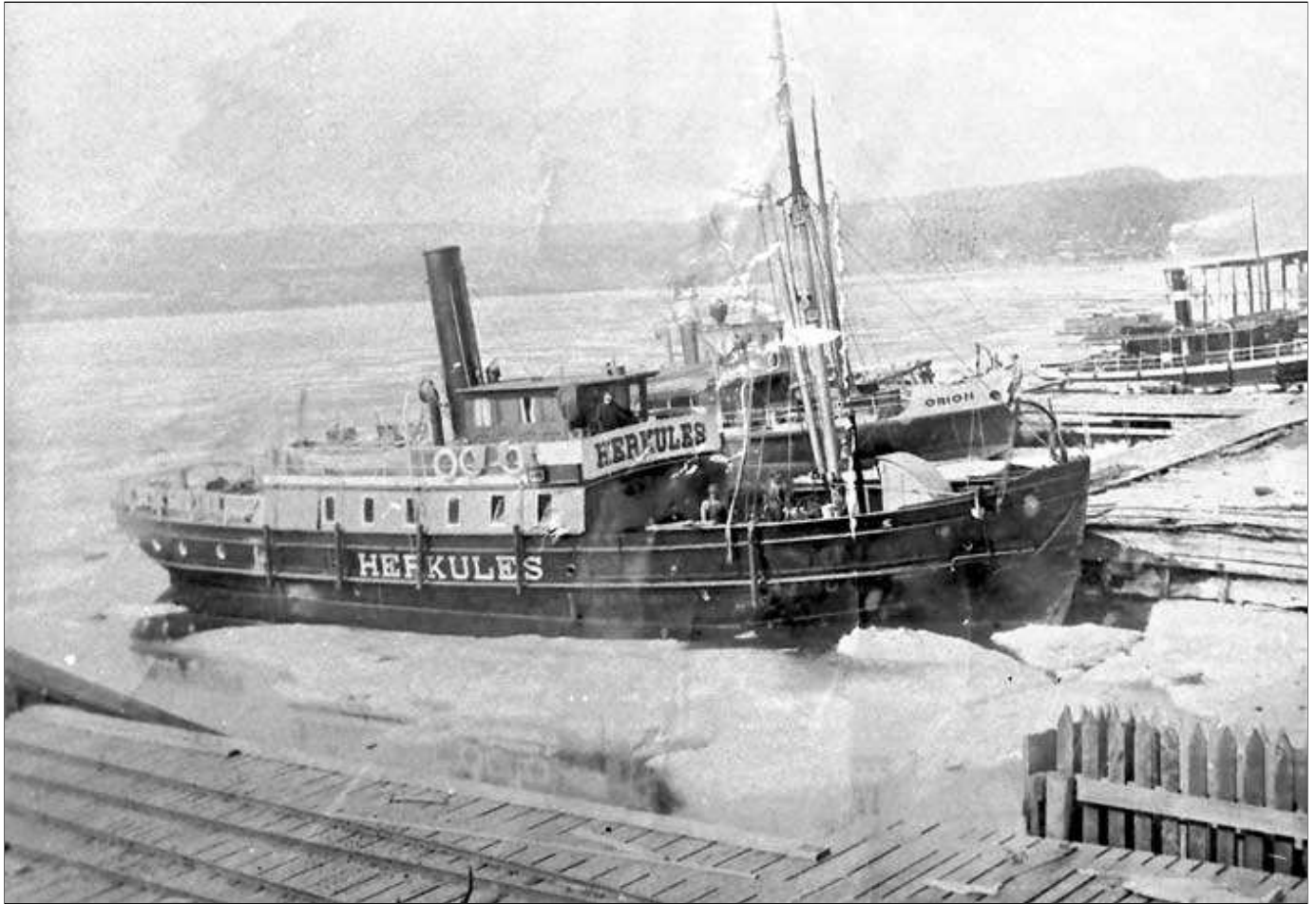
Bengt Westins saml.